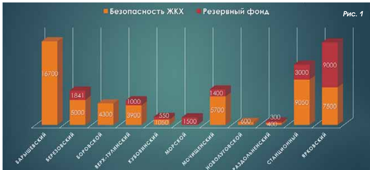
Финансирование мероприятий по подготовке объектов ЖКХ к ОЗП в 2015 году (тыс. руб.)