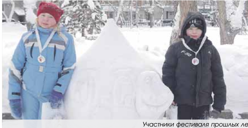
Участники фестиваля прошлых лет