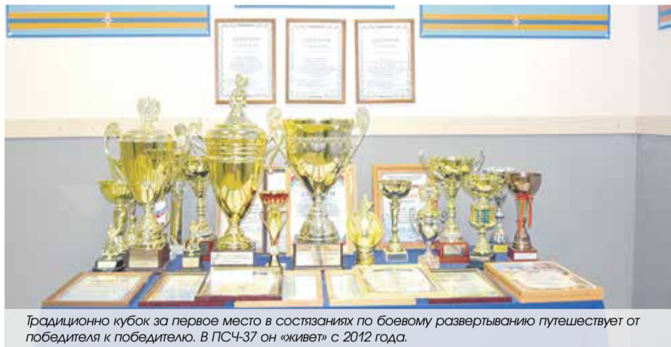
Традиционно кубок за первое место в состязаниях по боевому развертыванию путешествует от победителя к победителю. В ПСЧ-37 он «живет» с 2012 года.