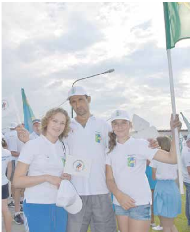
С 1 по 3 июля в г. Черепаново проходил финальный этап XXXIV летних Сельских игр. Наши герои заняли первое место в номинации «Семейные старты» — это принесло Новосибирскому району 40 баллов, которые в итоге позволили завоевать победу всей сборной!