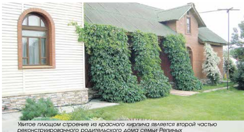
Увитое плющом строение из красного кирпича является второй частью реконструированного родительского дома семьи Репиных