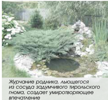
Журчание родника, льющегося из сосуда задумчивого тирольского гнома, создает умиротворяющее впечатление

«Затраты на постройку не столь существенны, как это может показаться. Главное — найти решение идеи, используя подручные материалы».