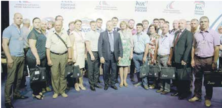
Делегация Новосибирского района