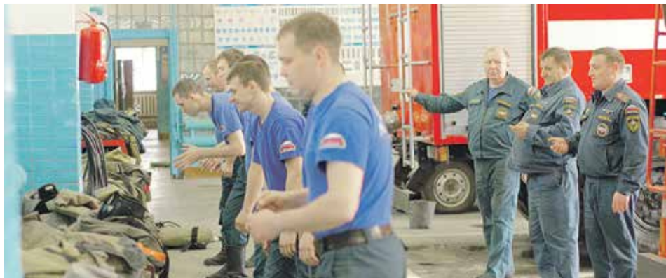
МЧС России является самой оперативной службой. Время прибытия пожарных спасателей составляет до 10 минут в городах и до 20 — в области

«На пожарного сдает!» — смеются над тем, кто любит долго и сладко поспать. А между тем времена, когда огнеборцы могли вволю отдышаться на службе, давно прошли, а может, и вовсе не наступали... Корреспонденты «НР» провели день в ПСЧ № 37, чтобы доказать: здесь ребятам не до сна.