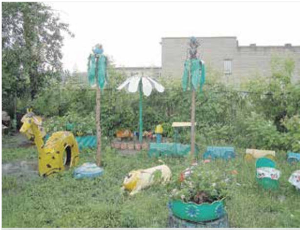
Уголок Поздняков любят все дети села