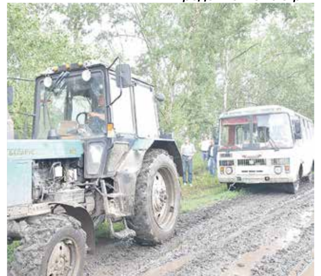
Продвигаться по раскисшим от дождей дорогам пришлось с помощью трактора