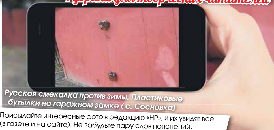
Русская смекалка против зимы. Пластиковые бутылки на гаражном замке (с. Сосновка)

Присылайте интересные фото в редакцию «НР», и их увидят все (в газете и на сайте). Не забудьте пару слов пояснений.