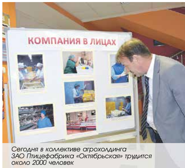
Сегодня в коллективе агрохолдинга ЗАО Птицефабрика «Октябрьская» трудится около 2000 человек