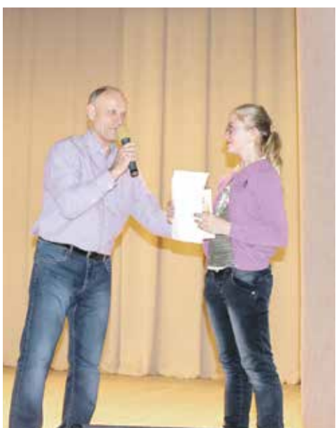
Девятый поэтический фестиваль прошел в с. Верх-Тула. Стр. 10