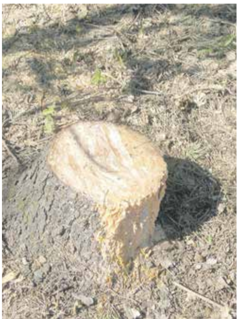
Чью рощу вырубил? Подробности на стр. 5