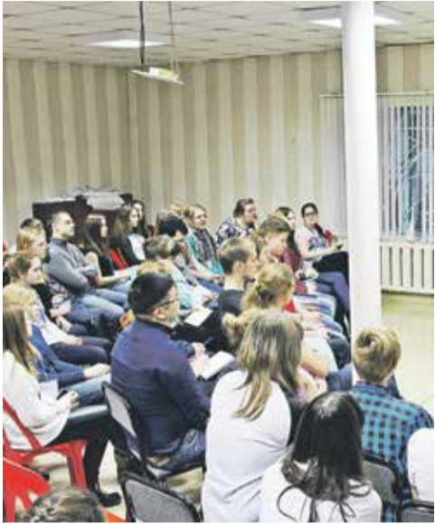
Антикризисный тренинг для молодежи. Читайте на стр. 4

№ 13 (95). 6 апреля 2016 Выходит по средам