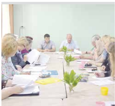
Выездная комиссия Совета депутатов Новосибирского района: работа на местах особенно плодотворна. Стр. 8