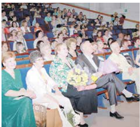
Детский сад «Колосок» — это 330 мест для дошколят, 13 групп и 58 сотрудников, которые занимаются воспитанием юных жителей Краснообска.