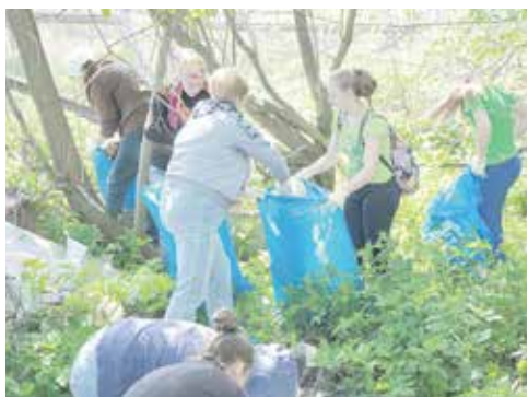
О том, как прошла экологическая акция «Чистый берег» в Барышево, читайте на стр. 10