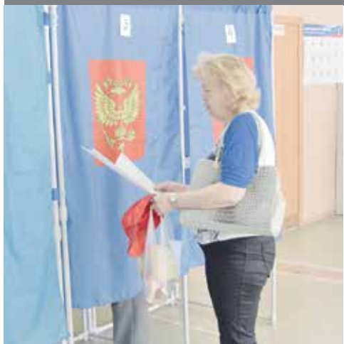
Предварительное голосование: тренировка перед выборами. Стр. 5

№ 21 (103). 1 июня 2016 Выходит по средам