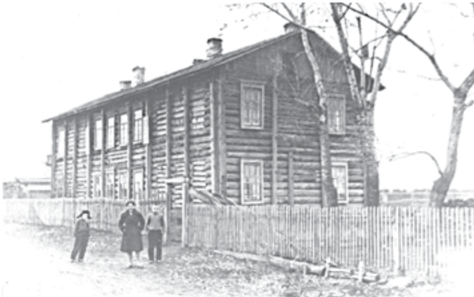
Первое здание детского дома

После нападения фашистской Германии на СССР в детдом стали поступать ребята, эвакуированные с запада страны. Жилось очень трудно: не хватало одежды, обуви, питания. Хлеб давали по 500 граммов на воспитанника. Спасало подсобное хозяйство, где выращи-