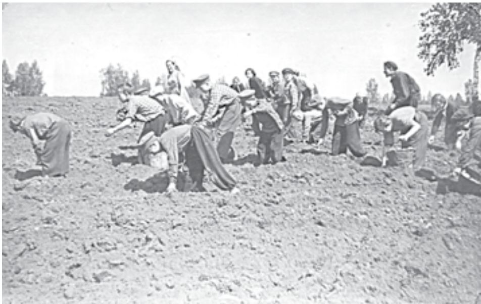
1955 г. Воспитанники детдома сажают картофель в подсобном хозяйстве

Здесь уже все соответствовало требованиям того времени: отопление, водоснабжение, канализация были подключены к близлежащему опытному заводу СИБИМЭ.