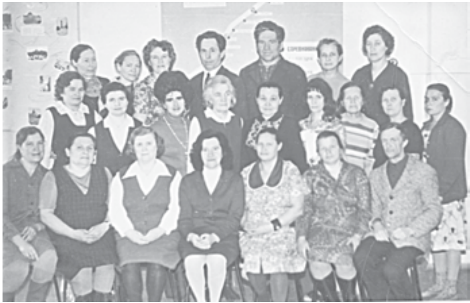
Послевоенный коллектив сотрудников

вали картофель и другие овощи. Несмотря на все невзгоды, дети старались помогать взрослым: все лето и осень они заготавливали дрова для отопления, косили сено, убирали урожай. И когда в День Победы перед сельским советом был устроен праздничный митинг, то весь Барышевский детдом был в одних рядах с односельчанами: это была и их Победа, выстраданная и долгожданная.