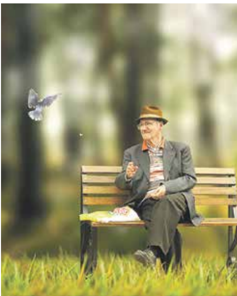
Декада пожилых людей. План мероприятий на стр. 11