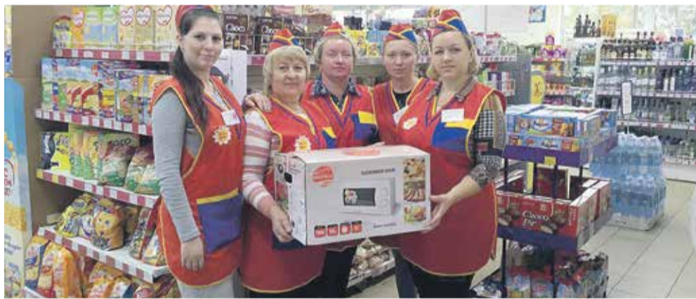
Коллектив магазина № 2 (с. Раздольное)

В системе Новосибирского райпотребсоюза уже стало традицией ежегодное проведение конкурса на лучшую организацию летней торговли, благоустройство и озеленение прилегающих территорий, основной целью которого является максимальное привлечение покупателей.