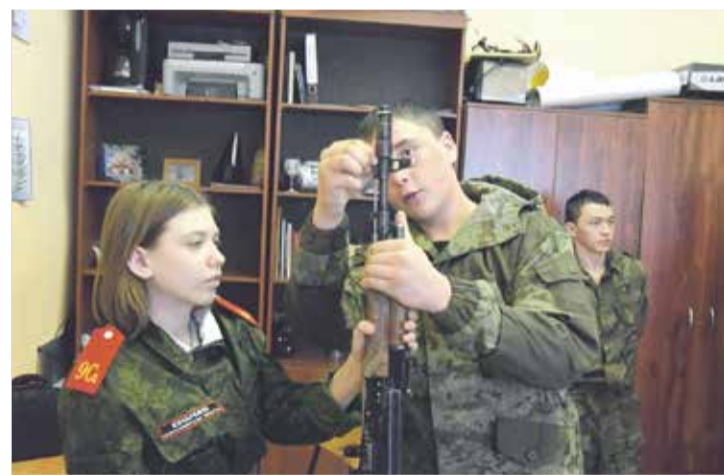
Взаимовыручка — первое, чему учат курсантов-юнармейцев