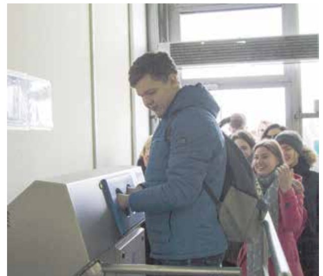
На тепличный комбинат школьники зашли так же, как и работники — после совершения необходимых дезинфекционных мероприятий