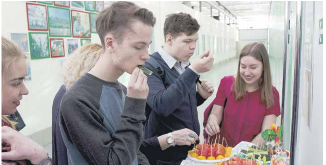
Огурцы, выращенные по новым технологиям, оказались очень вкусными!