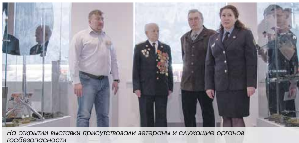
На открытии выставки присутствовали ветераны и служащие органов госбезопасности