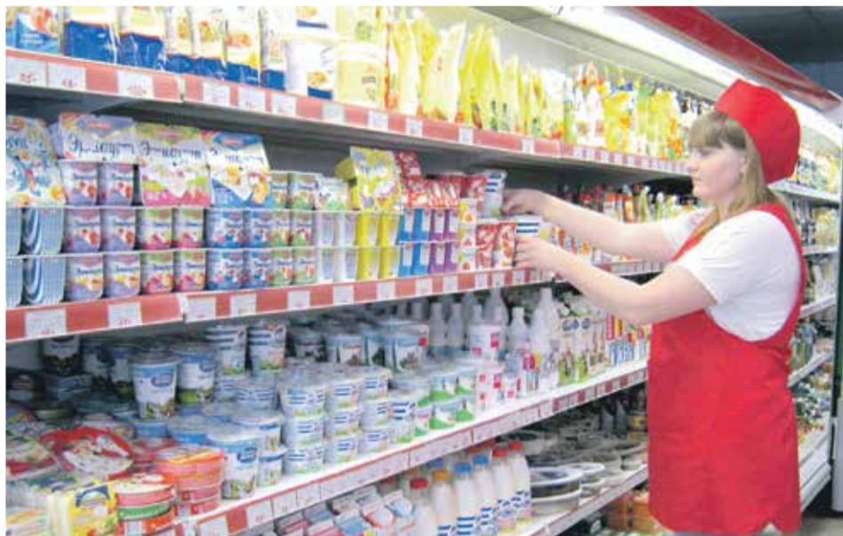
Большое внимание Новосибирский райпотребсоюз уделяет работе с кадрами, ведь хороший продавец — залог удачной торговли

Вместе с этим актуален и вопрос подготовки молодых кадров. Так, за счет средств будущих работодателей в СибУПК и кооперативном техникуме проходят обучение студенты, которые в дальнейшем станут работать на предприятиях системы.