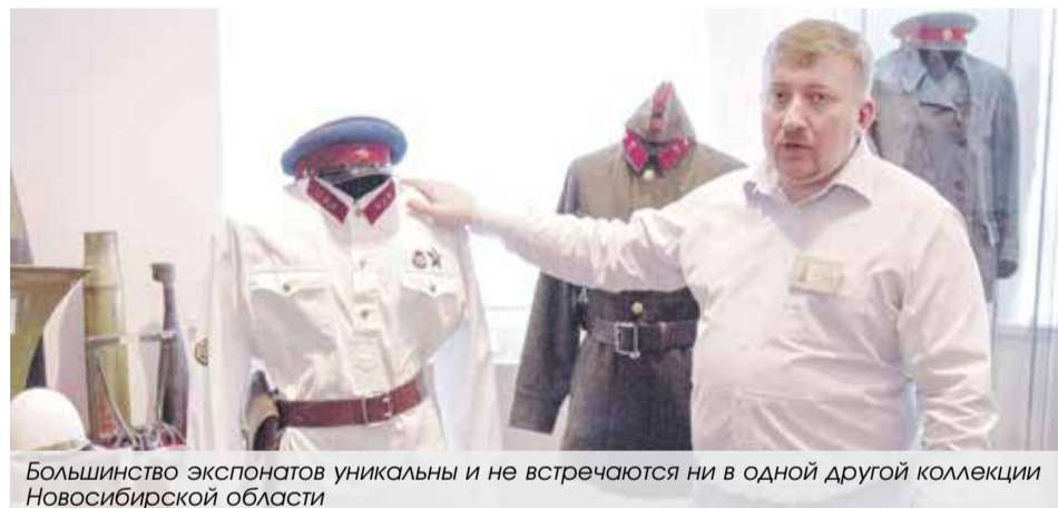
Большинство экспонатов уникальны и не встречаются ни в одной другой коллекции Новосибирской области