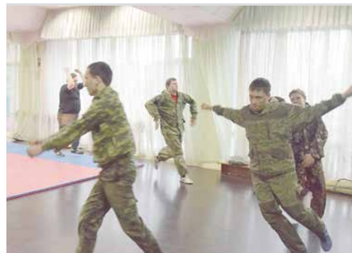
Дети тренируются наравне со взрослыми