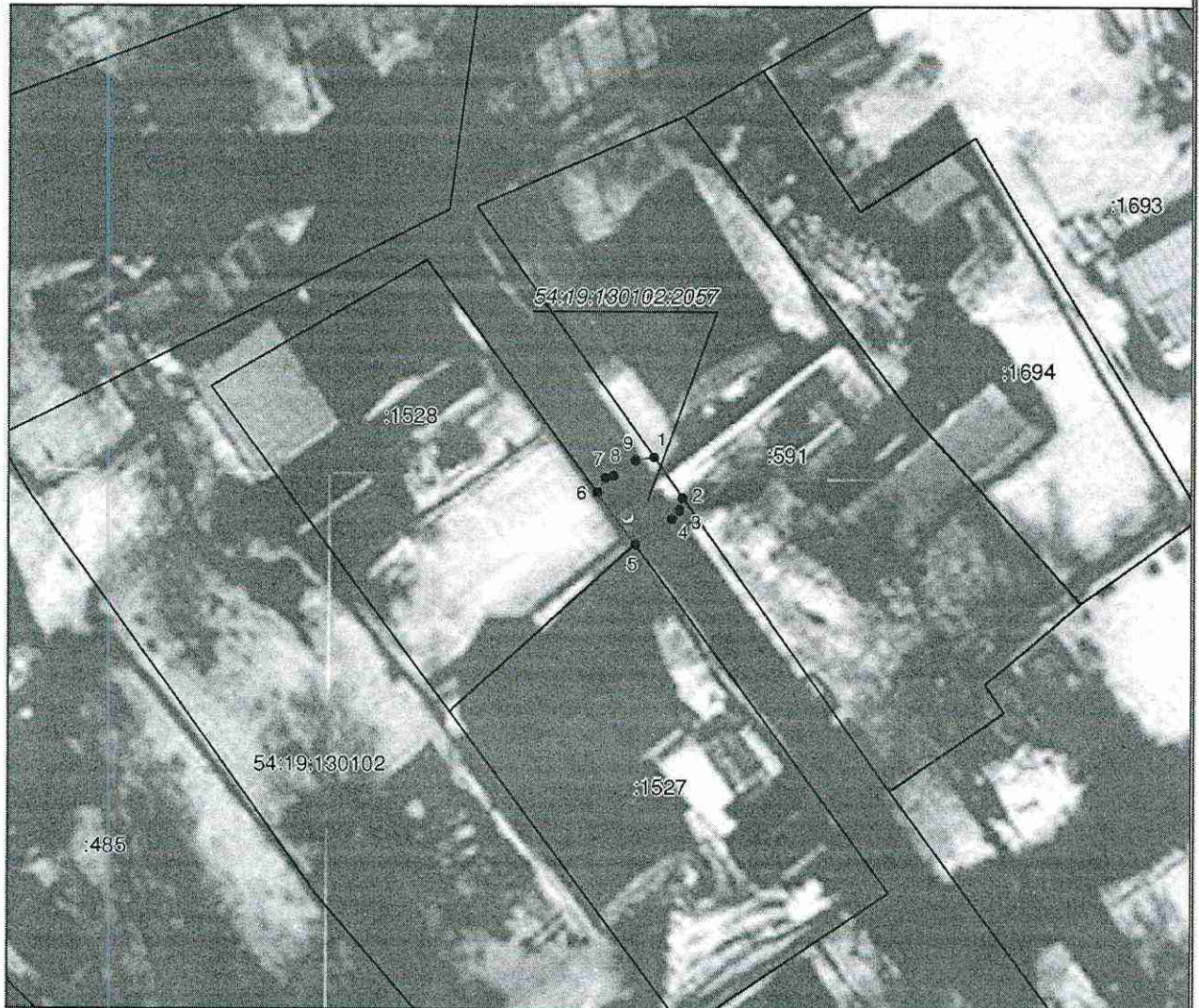
Масштаб 1: 500

(наименование объекта, местоположение границ которого описано)