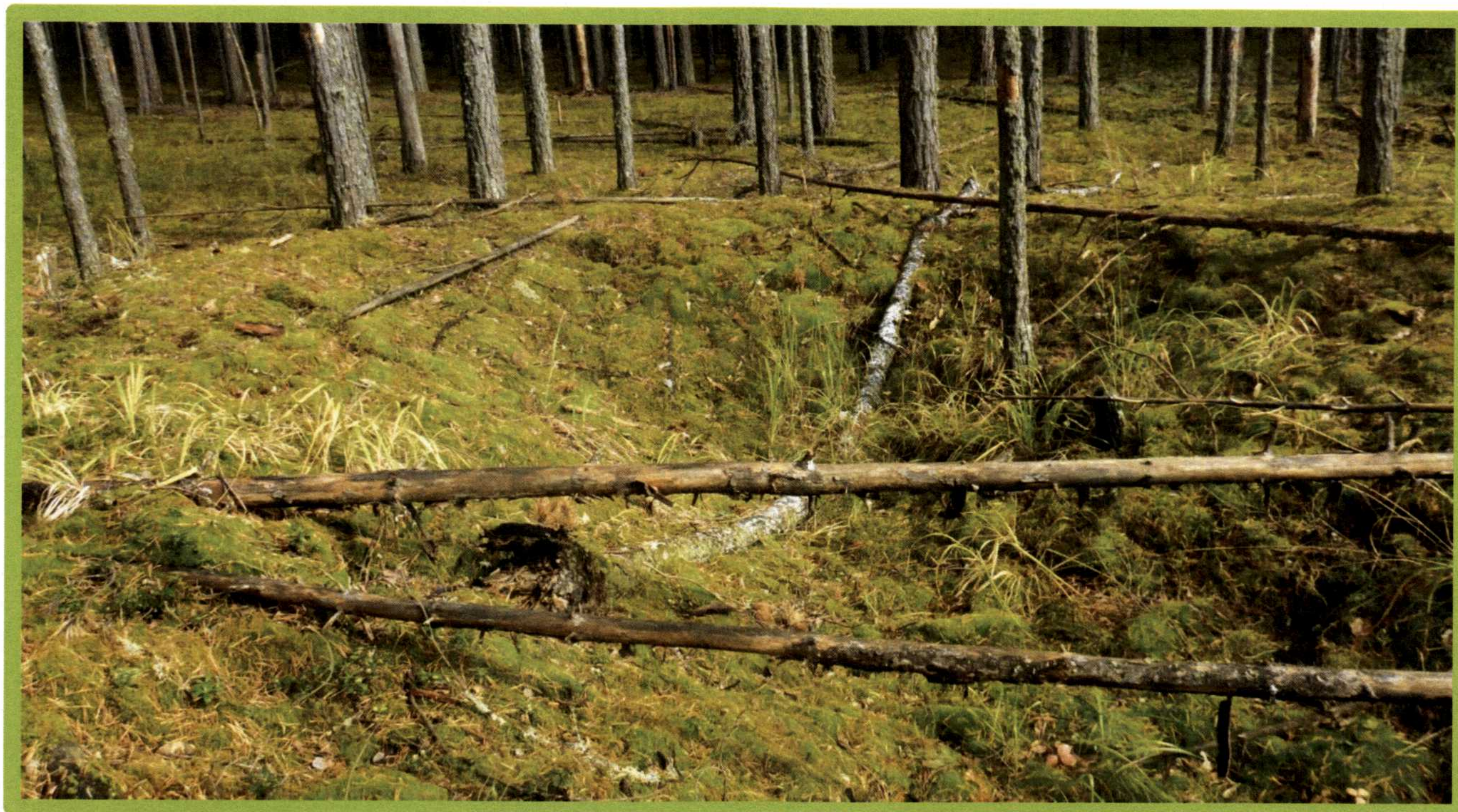
Изображение № 1 Валежник

Примеры валежника (смотри изображения №№ 1,2,3).