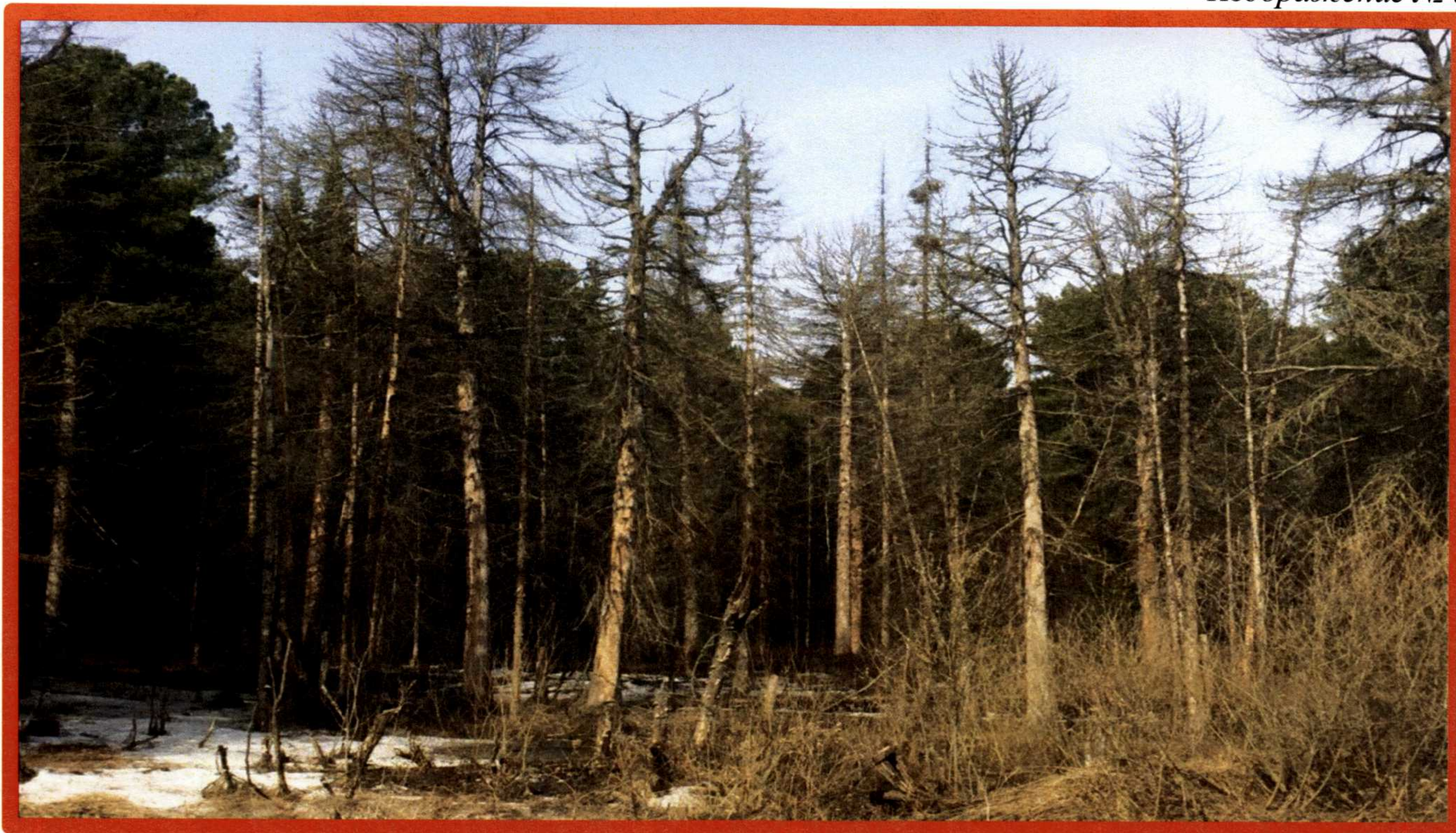
Изображение № 4 Сухостойное дерево. Не является валежником Изображение № 5

Кроме того, необходимо обратить внимание, что деревья, которые лежат на земле, но не имеют признаков естественного отмирания (имеют зеленую листву или хвою), определять как «мертвые» не допускается (смотри изображение № 5).