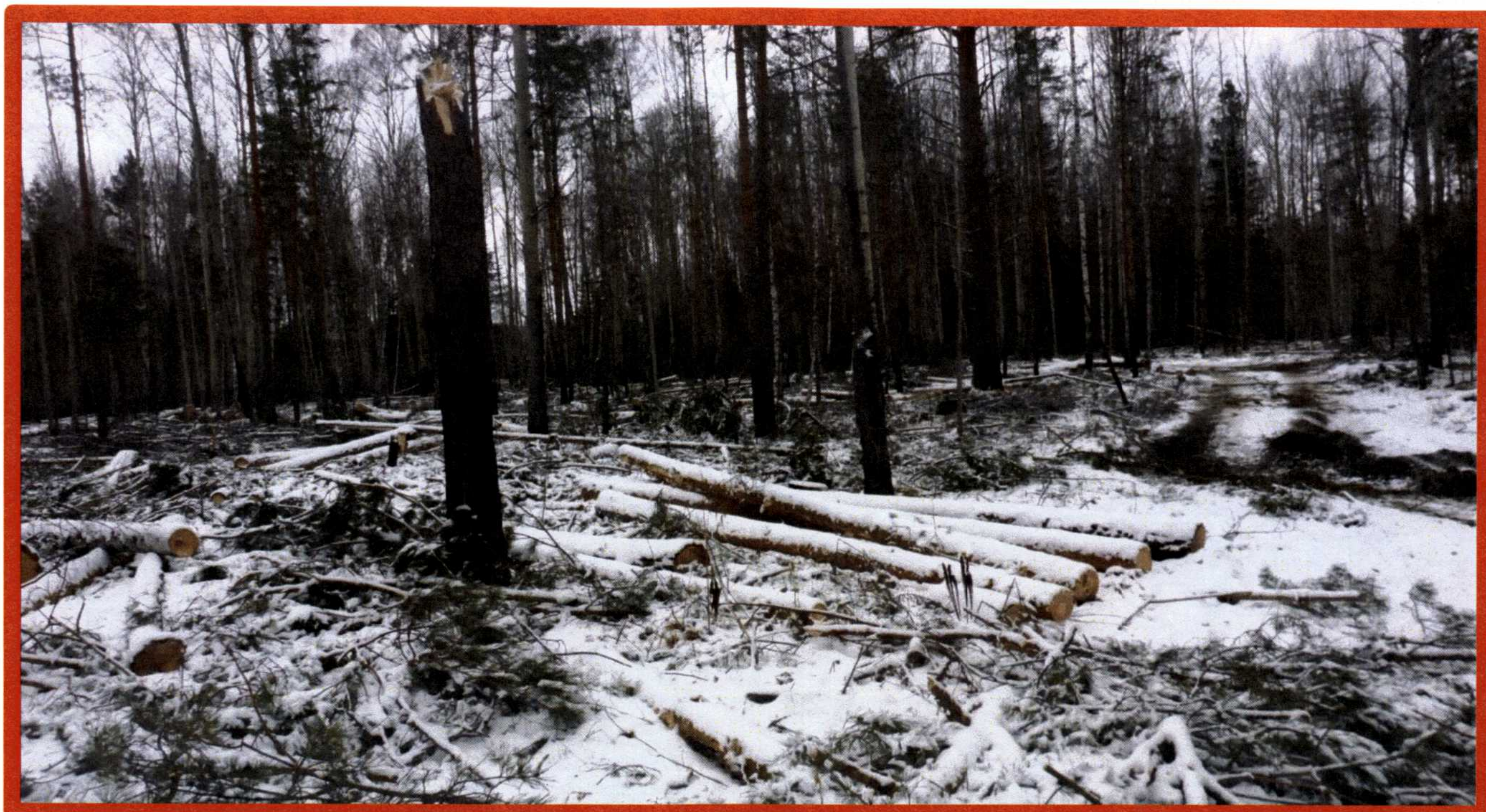
Изображение № 7 Брошенная древесина вдоль лесовозных дорог. Не является валежником