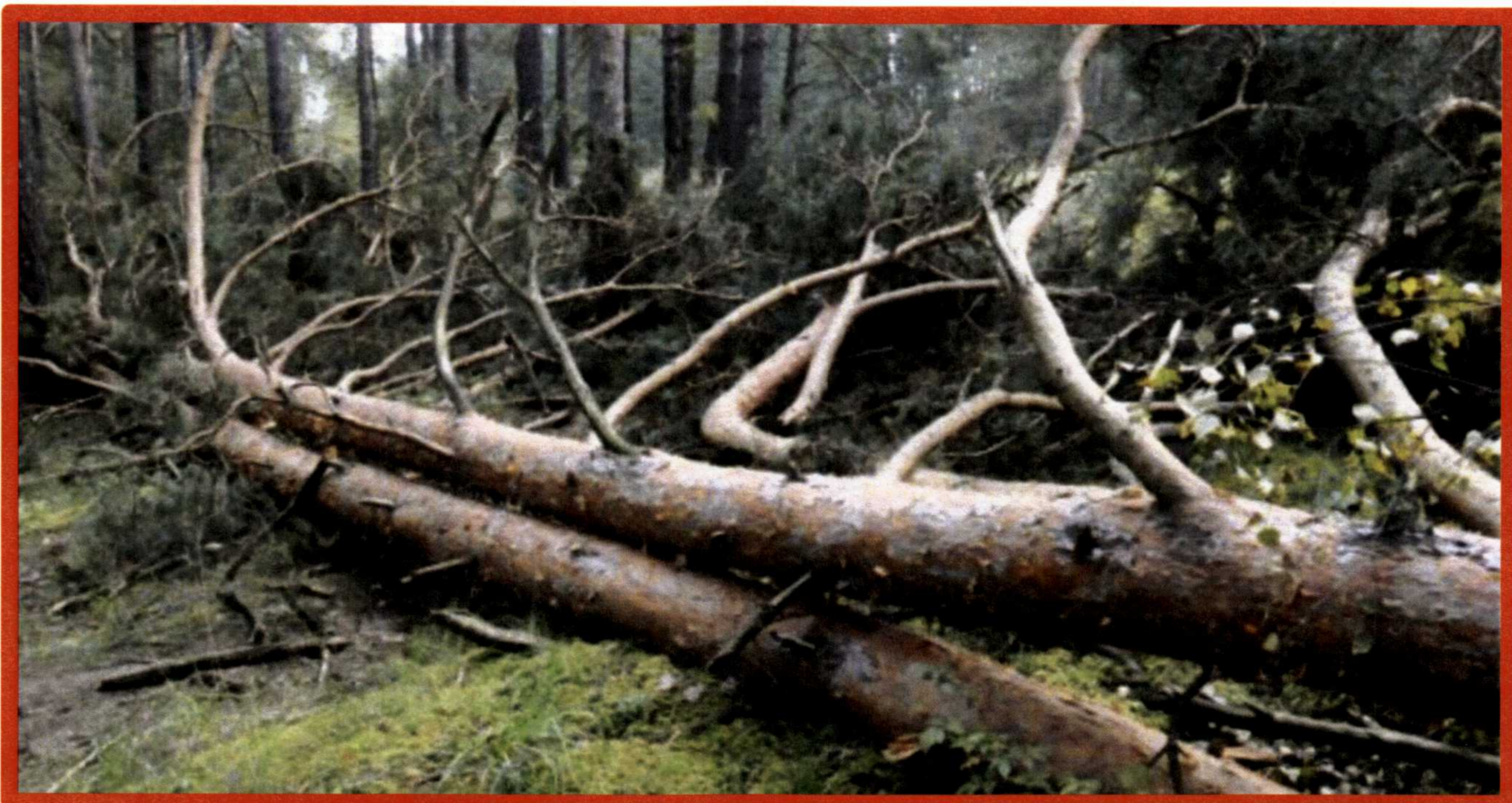
Лежащее на поверхности земли ветровальное дерево, не имеющее признаков отмирания. Не является валежником

Кроме того, необходимо обратить внимание, что деревья, которые лежат на земле, но не имеют признаков естественного отмирания (имеют зеленую листву или хвою), определять как «мертвые» не допускается (смотри изображение № 5).