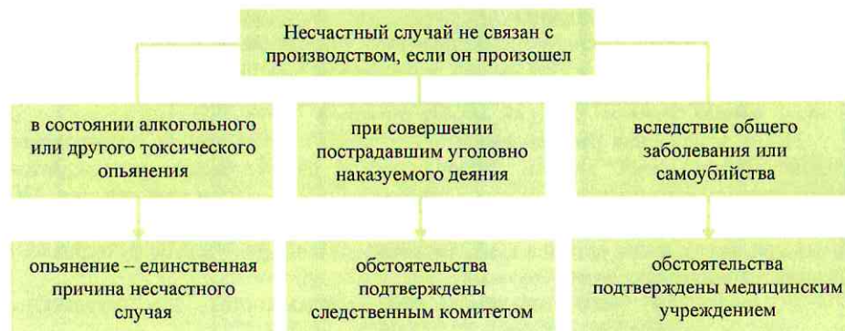
Рис. 1. Квалификация несчастного случая как несчастного случая, не связанного с производством

– заключение выборного органа первичной профсоюзной организации или иного уполномоченного представительного органа работников (при его наличии).