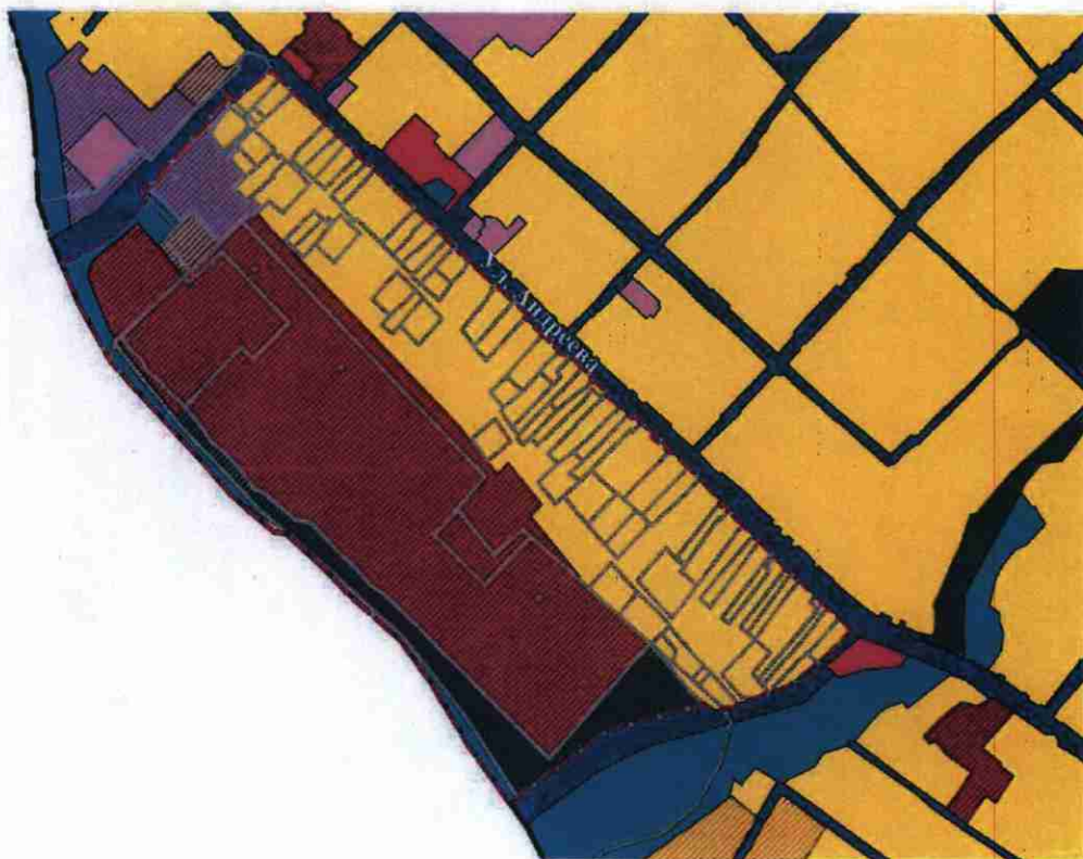
СХЕМА границ территории проектирования